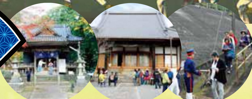
木葉宇都宮神社 徳成寺 JR田原坂駅

参加無料 | コース内にある有料施設をご利用になる場合や現地までの交通費は各自のご負担となります 事前申込不要 | 当日、JR田原坂駅へお越しください