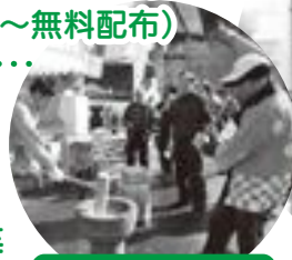
好評のつきたて餅